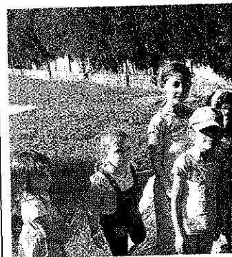
■ Les plus jeunes ne boudent pas la ca

Vendredi, la poésie et le cirque se sont installés rue Jeunet. La cabine « Poématon » invitait enfants, ados et parent à écouter les poèmes sélectionnés par la