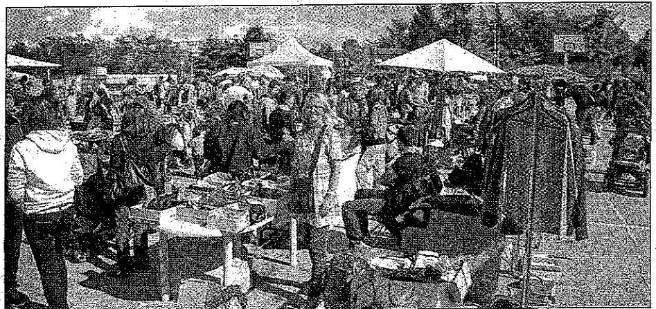
Malgré un temps incertain en matinée, de nombreux visiteurs ont arpenté les allées à l'extérieur du gymnase des Battières

Très indécis en début de matinée en raison de la pluie, les quelque 90 exposants se sont laissés convaincre de patienter un peu par les organisateurs. Avec raison, puisque vers 11 heures, le soleil reprenait la main. Et cette année encore, les visiteurs étaient nombreux à arpenter les extérieurs du gymnase des